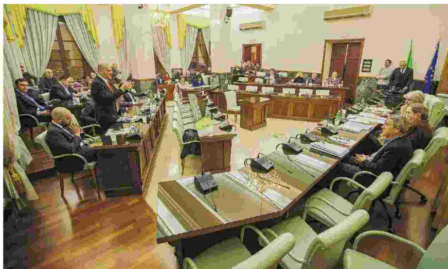
Un'immagine del consiglio provinciale di Frosinone

● I punti all'ordine del giorno della seduta del consiglio provinciale. La prima dopo le elezioni dell'otto gennaio